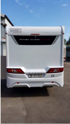
Rückansicht des Fahrzeugs