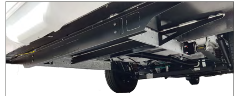
seitliches Ende des Rahmenprofils

Alle Bilder bitte von beiden Seiten , vom Boden aus (tief) und etwas entfernt vom Fahrzeug machen.